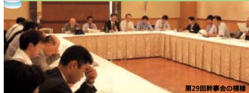
第29回幹事会の模様

第27回(2005年度第1回幹事会) 日時：2005年6月4日(土)16時 場所：I.S.D布施(留学生寮)2階会議室 議題：2004年度校友会事業報告(案)及び収支決算書(案)について 第4期校友会幹事の選出について