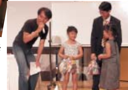
子ども全員にお菓子のプレゼント

さて、大阪経済法科大学教育後援会は、「大学の教育方針に則り、大学と家庭との連絡を密にし、教育事業の援助・会員相互の親睦を図ること」を目的とし、1983年に父母会として発足しました。本年度からは、教育後援会と名称を改め、活動を行っております。この間、学生の教育研究活動、課外活動への支援、経済的な理由で学費の支弁が困難な学生に対しての奨学事業、父母懇談会の開催時における特別講演会の開催、地方での父母懇談会の支援など、会員相互の親睦や交流のための事業も、地域社会とも連携をとりつつ、積極的に展開し続けてきました。