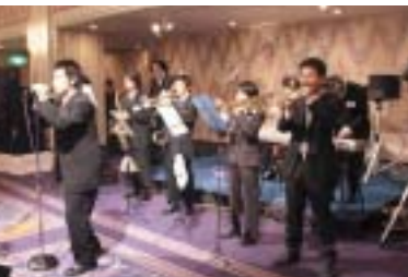
在学生のバンド演奏