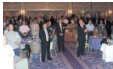
卒業生、在校生、教職員全員で学歌を熱唱