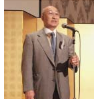
開会の挨拶をされる沢勲副会長(学長補佐)